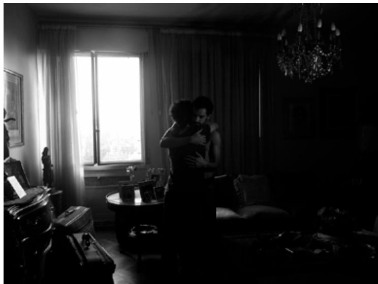
Nº 3 0,55 x 0,41 Toma Directa Digital, Archival Print. 1/5 + 2 obras de autor. 2010. (Serie de 5 obras)