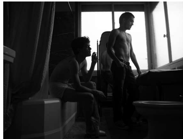
Nº 1 0,55 x 0,41 Toma Directa Digital, Archival Print. 1/5 + 2 obras de autor. 2010. (Serie de 3 obras)