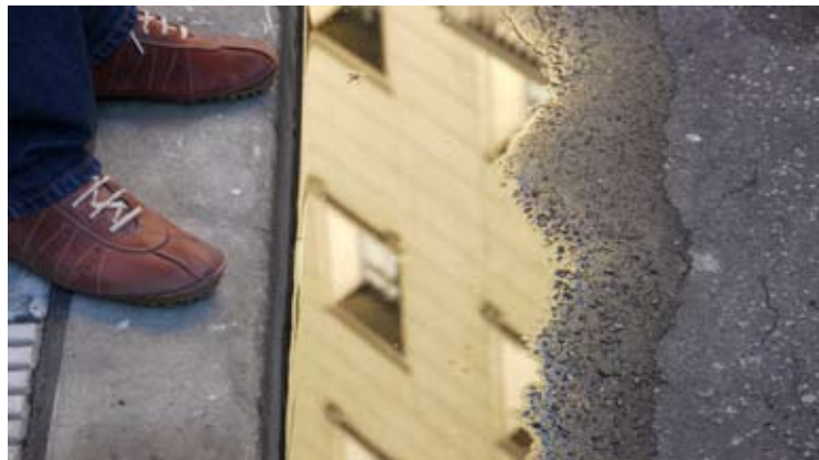
Borde 0,60 x 0,34 Toma Directa digital, Archival Print. 15 + 2 obras de autor. 2010. (Díptico)