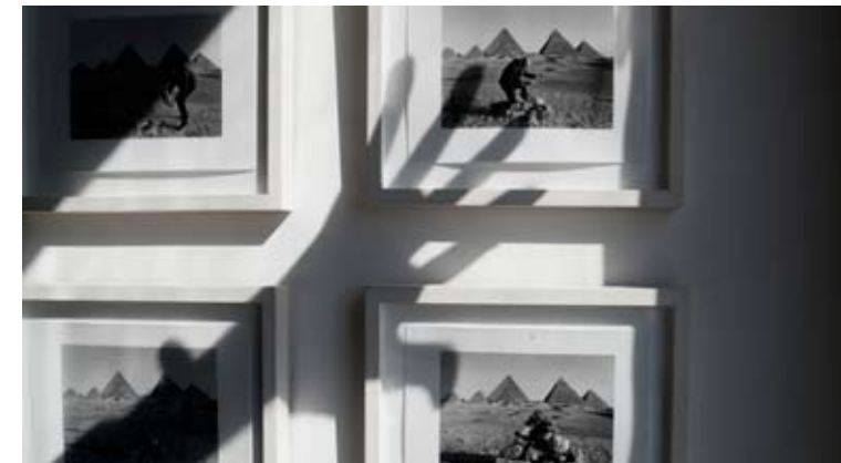
Reaching Duane 0,60 x 0,34 Toma Directa digital, Archival Print. 15 + 2 obras de autor. 2010. (Díptico)