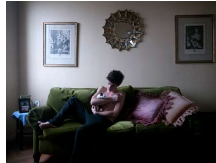
Nº 2 0,22 x 0,16 Toma Directa Digital, Archival Print. 1/5 + 2 obras de autor. 2010. (Díptico)