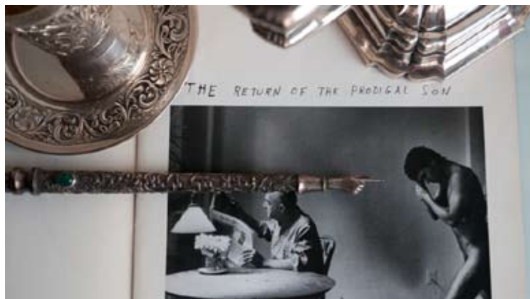
Prodigal Son 0,60 x 0,34 Toma Directa Digital, Archival Print. 1/5 + 2 obras de autor. 2010. (Díptico)