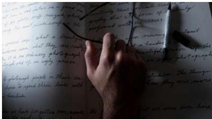
Writings 0,60 x 0,34 Toma Directa Digital, Archival Print. 1/5 + 2 obras de autor. 2010. (Díptico)