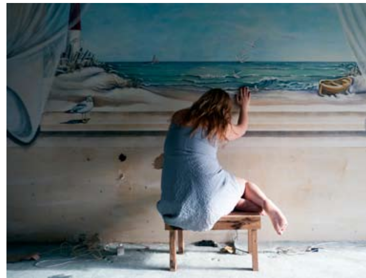
Nº 1 0,22 x 0,16 Toma Directa Digital, Archival Print. 1/5 + 2 obras de autor. 2010. (Díptico)