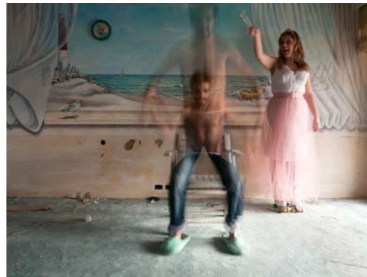
Nº 2 0,22 x 0,16 Toma Directa Digital, Archival Print. 1/5 + 2 obras de autor. 2010. (Serie de 5 obras)