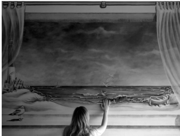
Playa 100 x 100 Toma Directa Digital, Archival Print. 1/5 + 2 obras de autor. 2010