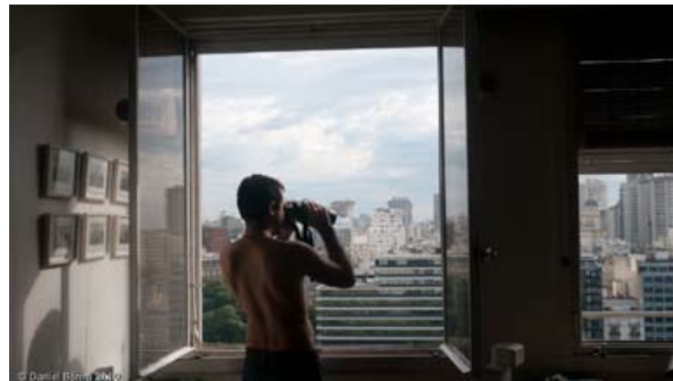
Ventana 0,60 x 34 Toma Directa Digital. Archival Print. 1/5. 2010. (Díptico)