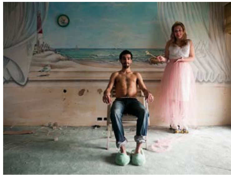
Nº 1 0,22 x 0,16 Toma Directa Digital, Archival Print. 1/5 + 2 obras de autor. 2010. (Serie de 5 obras)