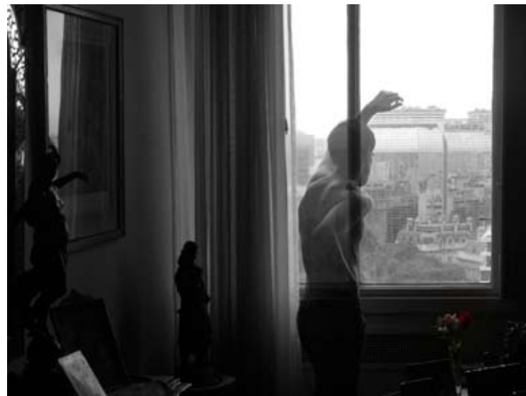
Nº 5 0,55 x 0,41 Toma Directa Digital, Archival Print. 1/5 + 2 obras de autor. 2010. (Serie de 5 obras)