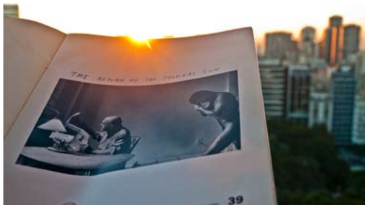
Sunset at DM 0,60 x 0,34 Toma Directa digital, Archival Print. 15 + 2 obras de autor. 2010. (Díptico)