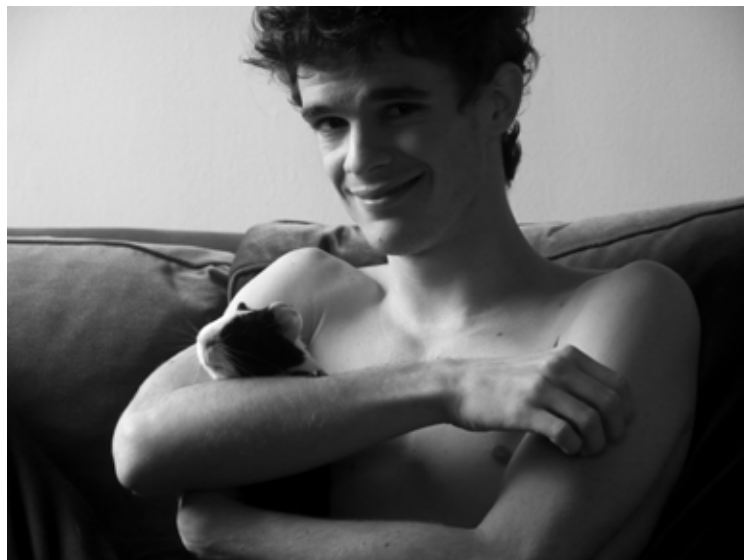
Nº 3 0,55 x 0,41 Toma Directa Digital, Archival Print. 1/5 + 2 obras de autor. 2010. (Serie de 3 obras)