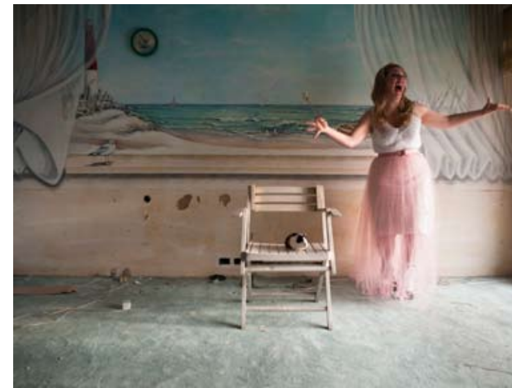
Nº 5 0,22 x 0,16 Toma Directa Digital, Archival Print. 1/5 + 2 obras de autor. 2010. (Serie de 5 obras)